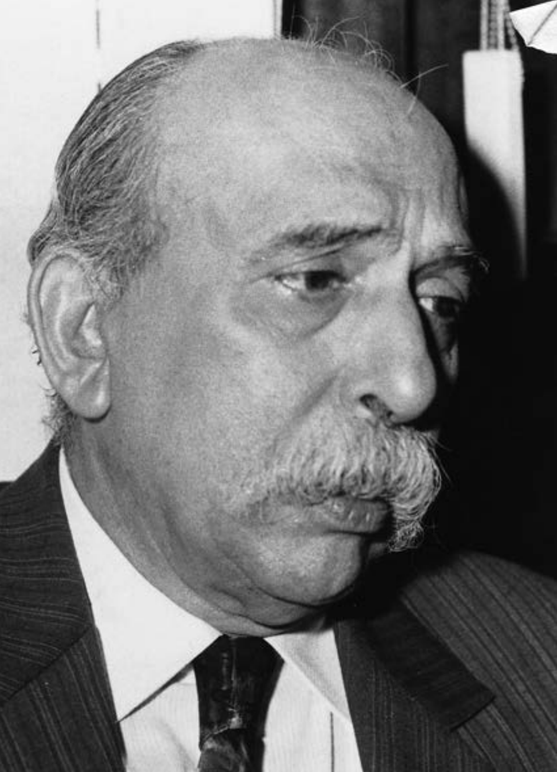
El periodista venezolano Óscar Yanes.