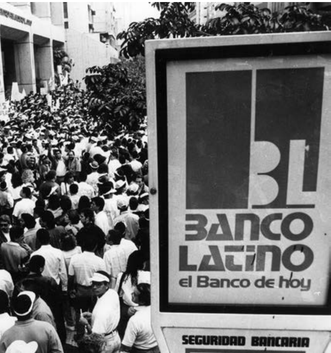
Protestas ante la crisis bancaria en Venezuela, 1994.