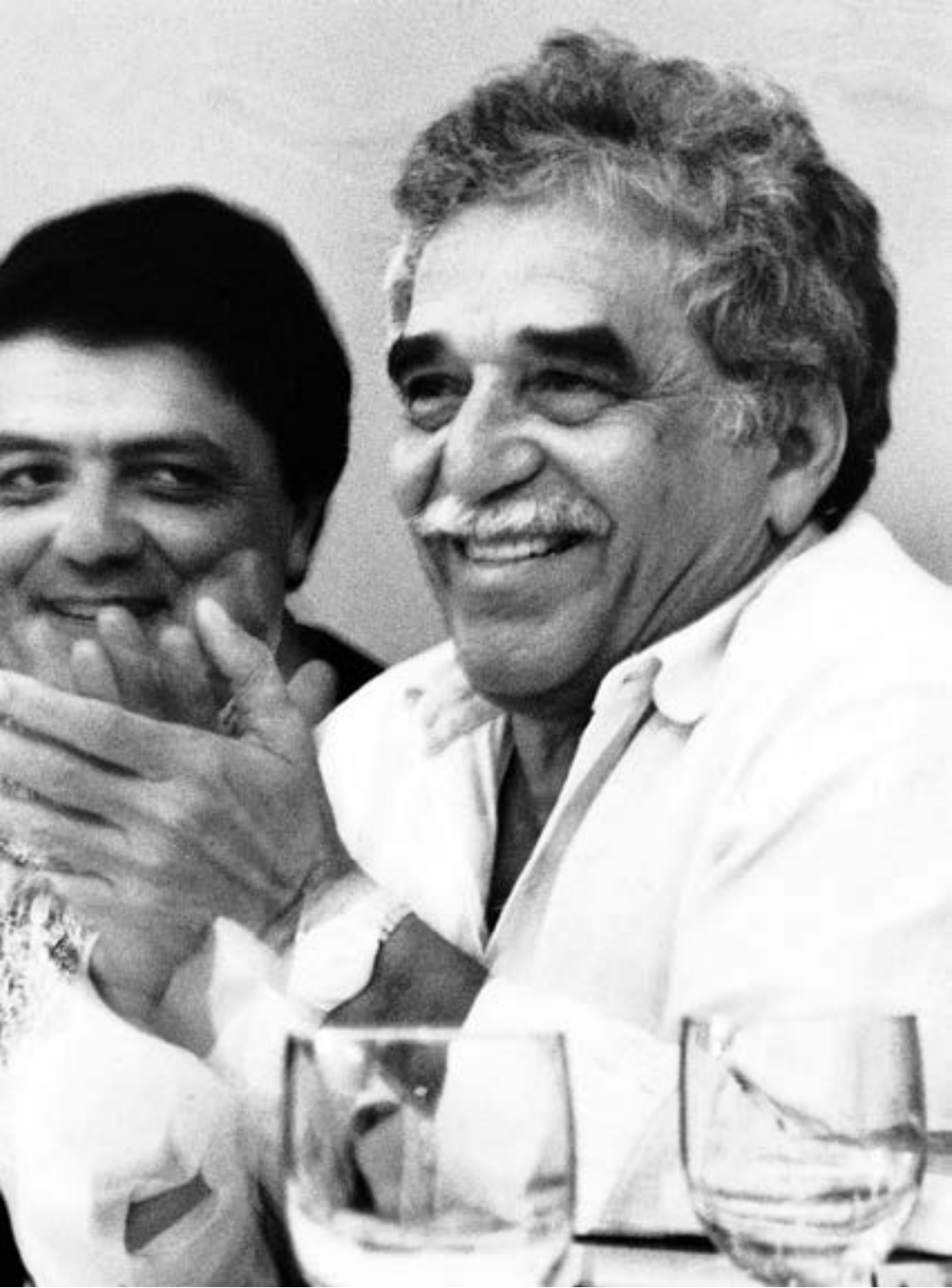
Gabriel García Márquez.