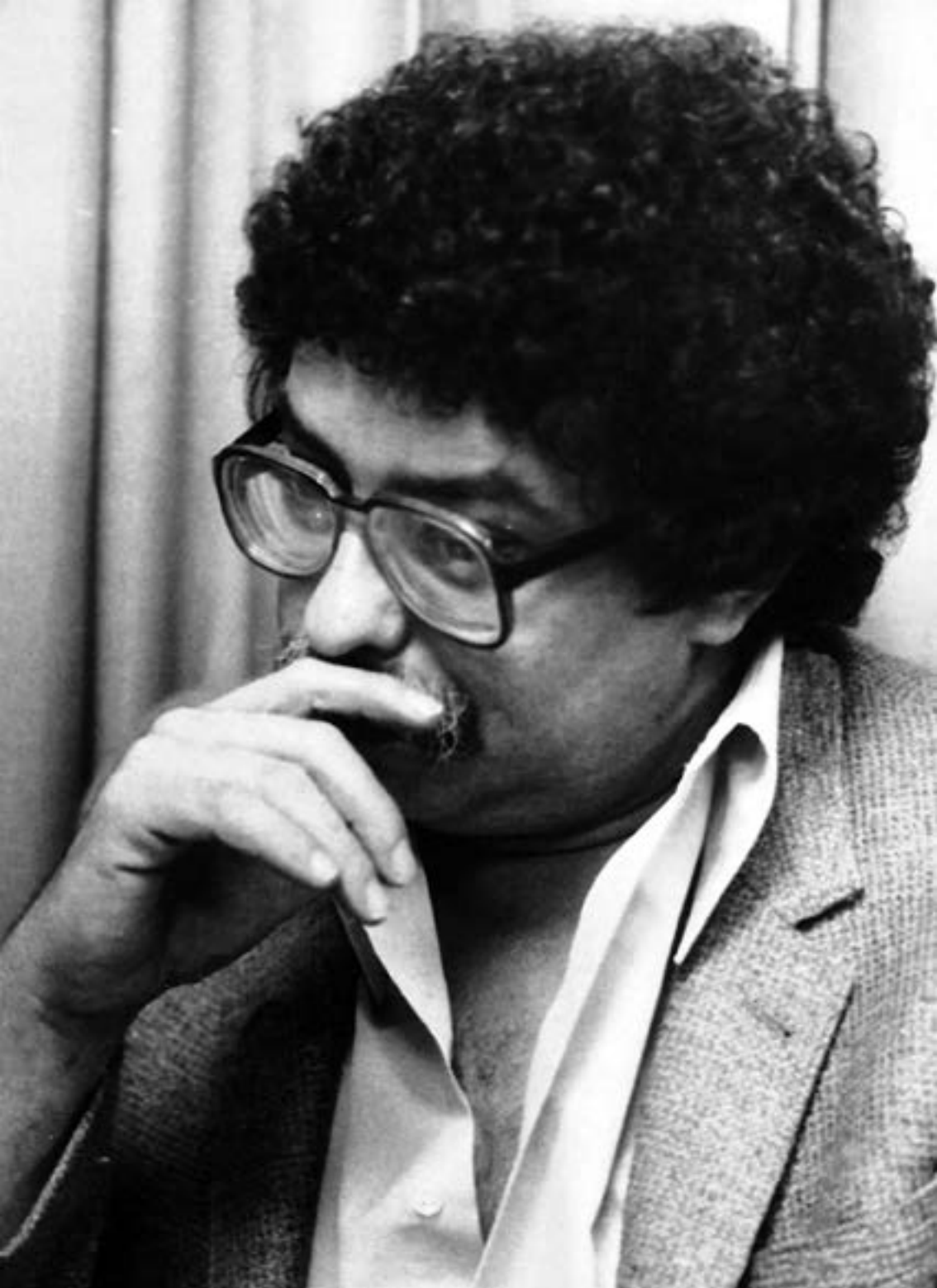
José Ignacio Cabrujas.