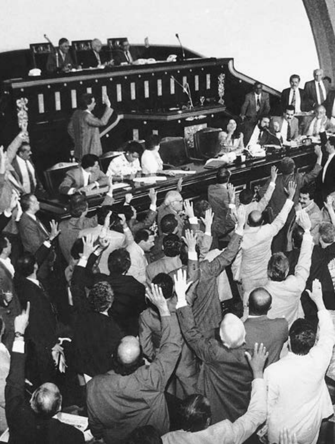
El Congreso de la República de Venezuela votando a favor del juicio político del entonces presidente Carlos Andrés Pérez en 1993.