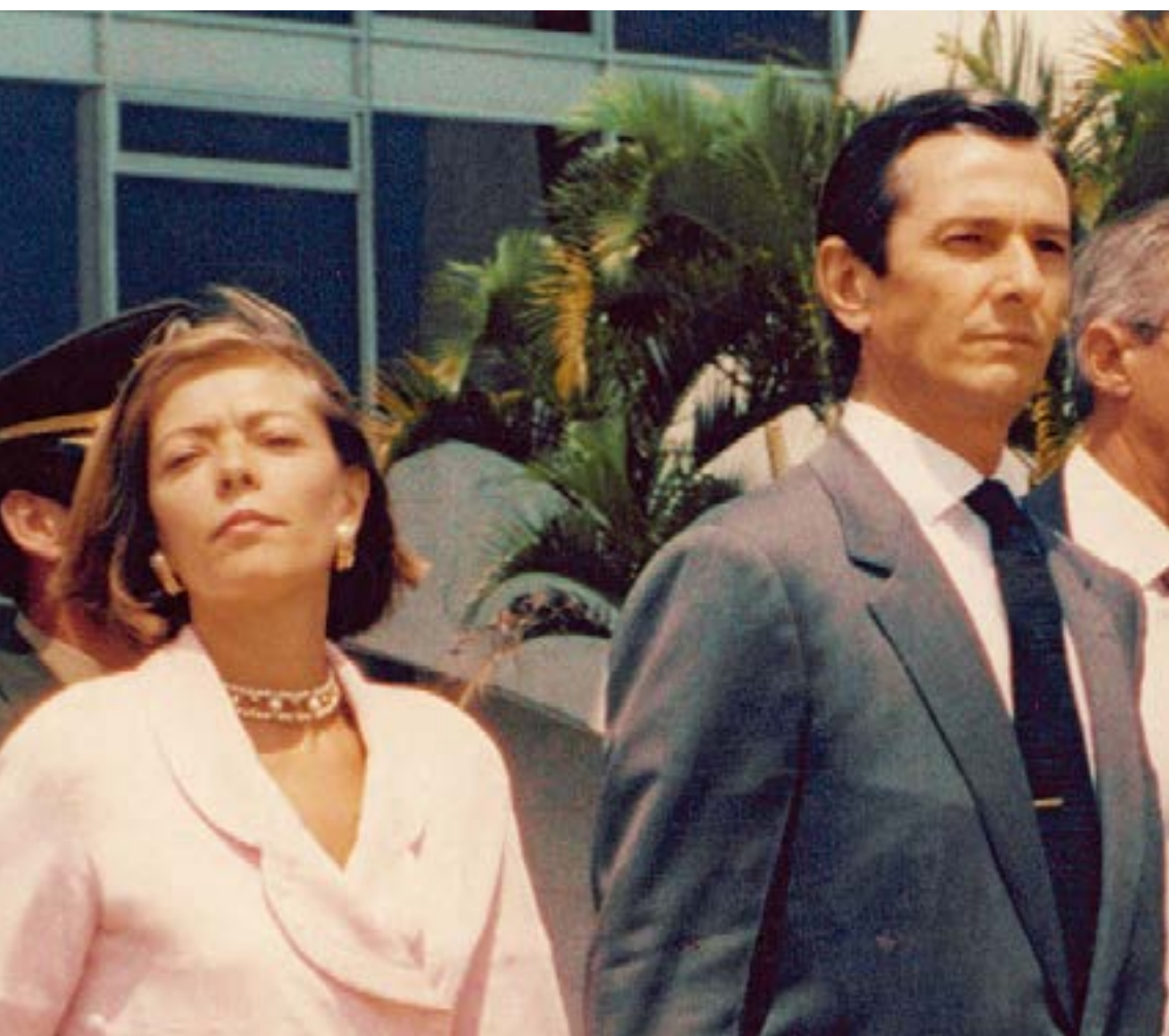
Fernando Collor de Mello y su entonces esposa Rosane Malta saliendo del Palacio da Alvorada después del impeachment que lo destituiría de la Presidencia de la República.