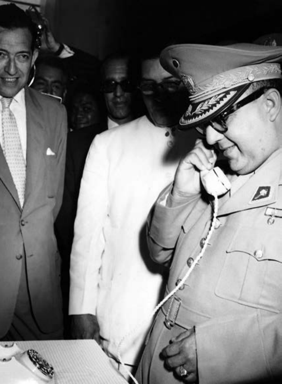
Marcos Pérez Jiménez.