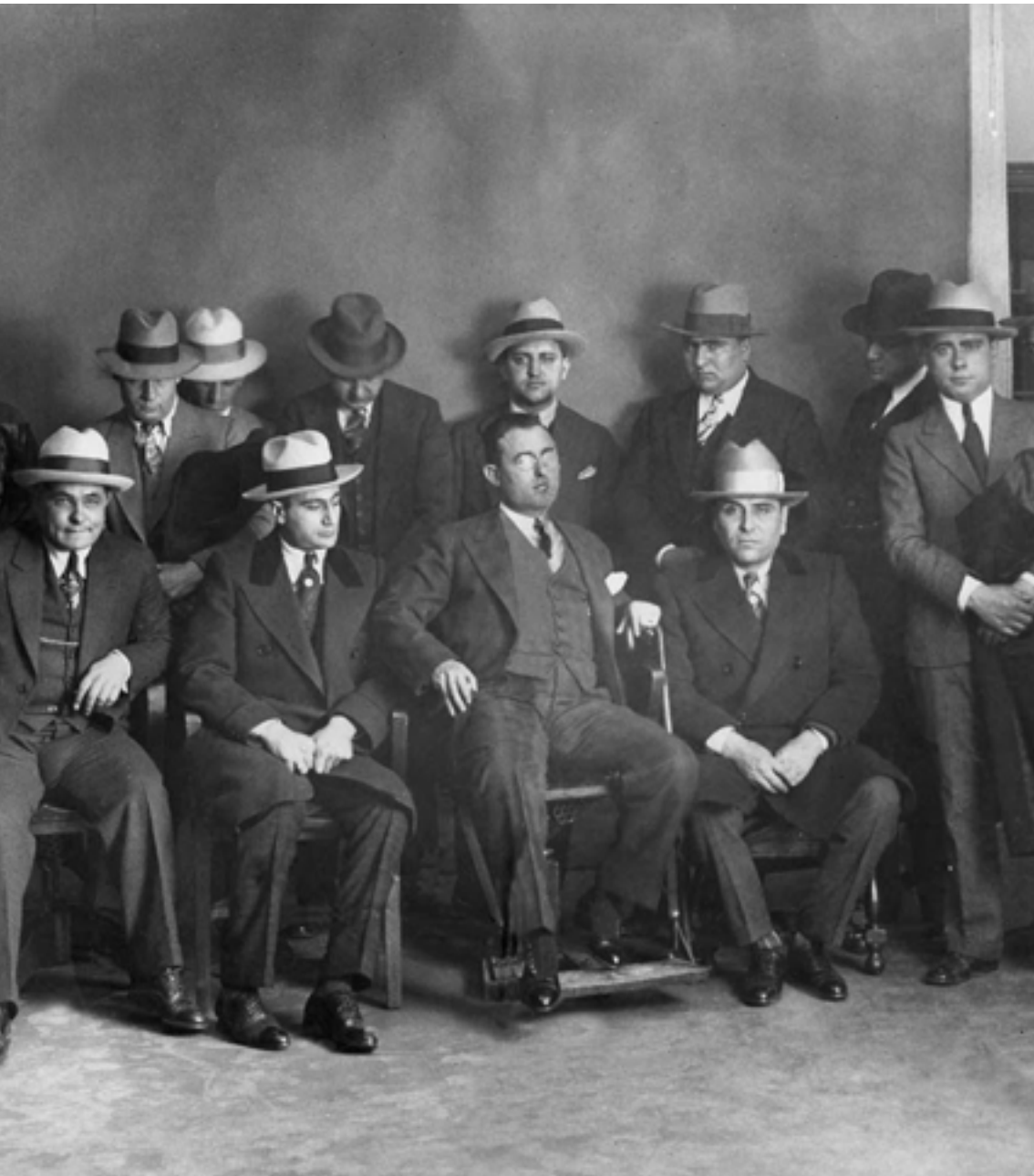
Cosa Nostra: la mafia italiana.