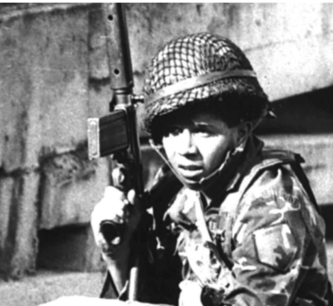
Soldado venezolano durante el levantamiento militar del 4 de febrero de 1992.