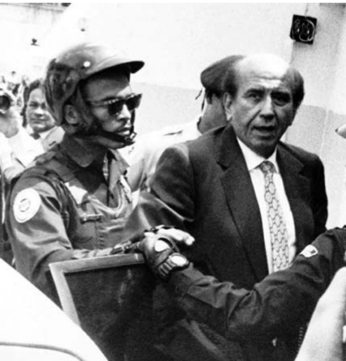
Carlos Andrés Pérez después de su destitución de la Presidencia de la República de Venezuela.