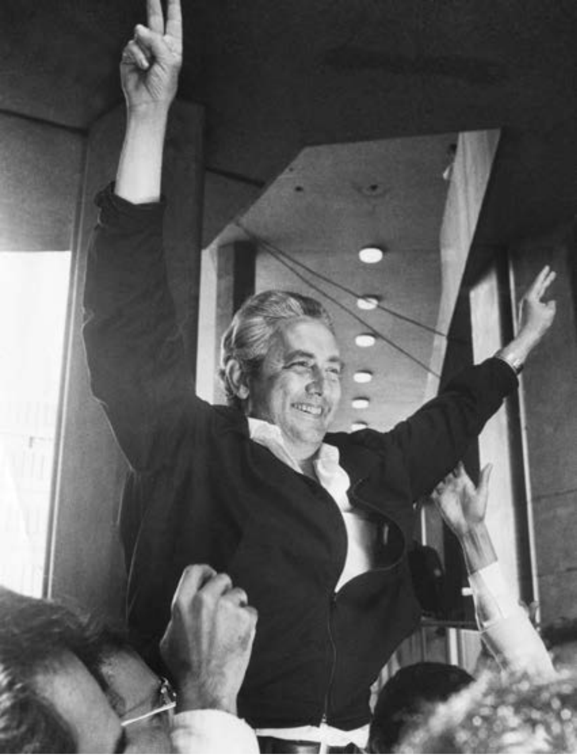
Henrique Salas Römer, dos veces gobernador del estado Carabobo.