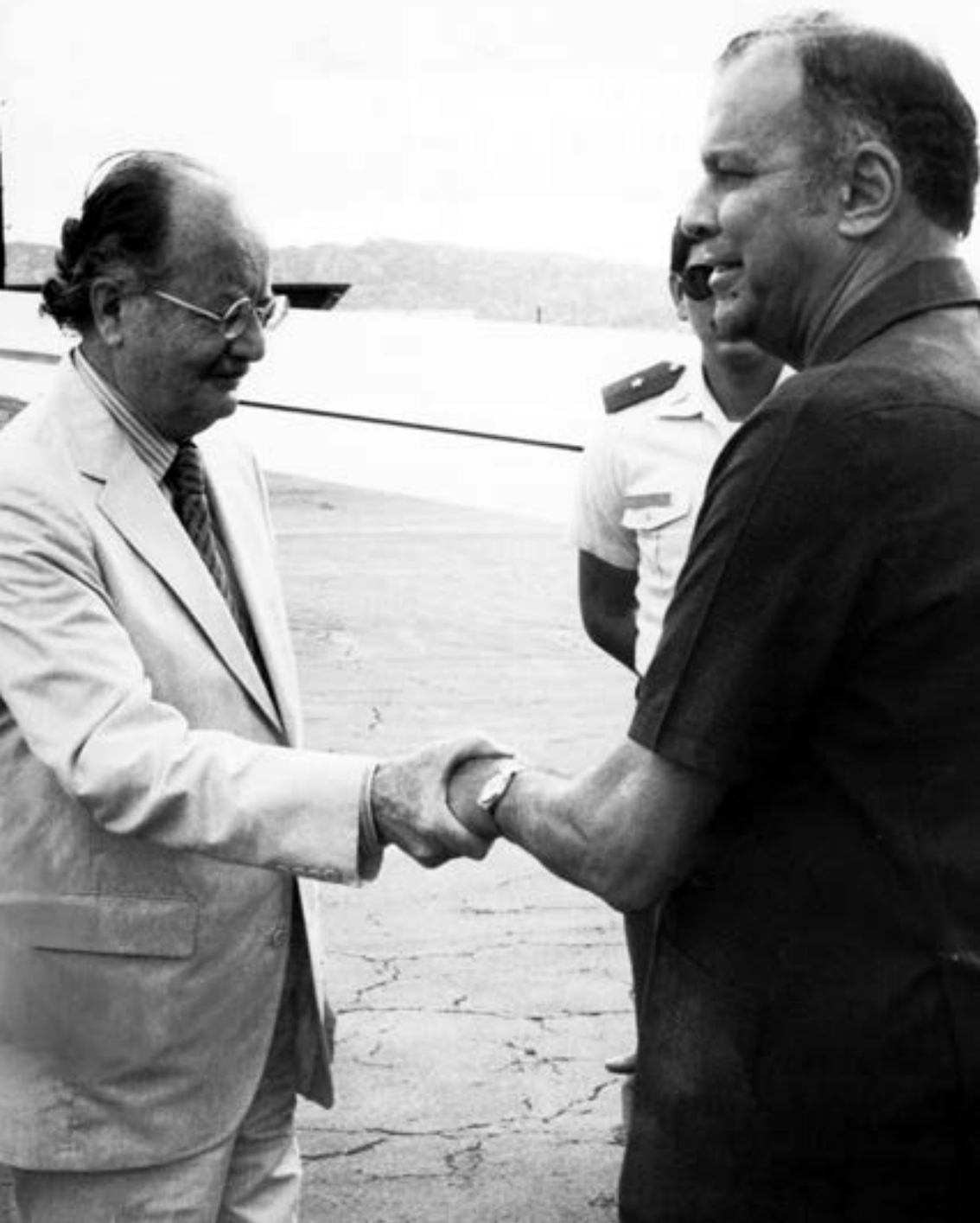
Simón Alberto Consalvi durante su período como canciller de la República.