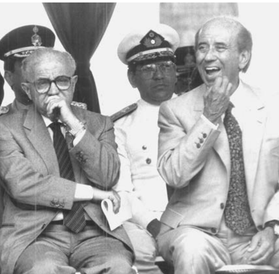
Luis Piñerrúa Ordaz y Carlos Andrés Pérez durante el 4 de febrero de 1992.