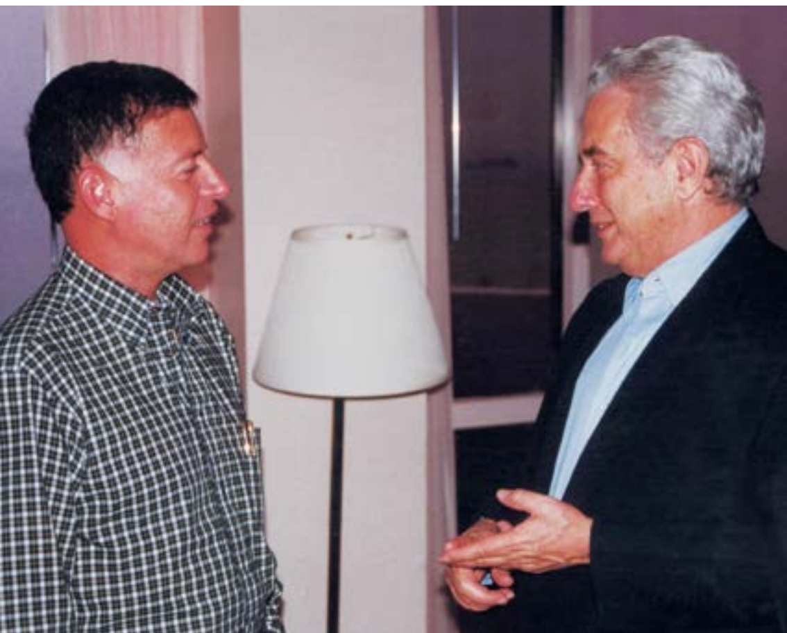
Francisco Arias Cárdenas y Henrique Salas Römer.