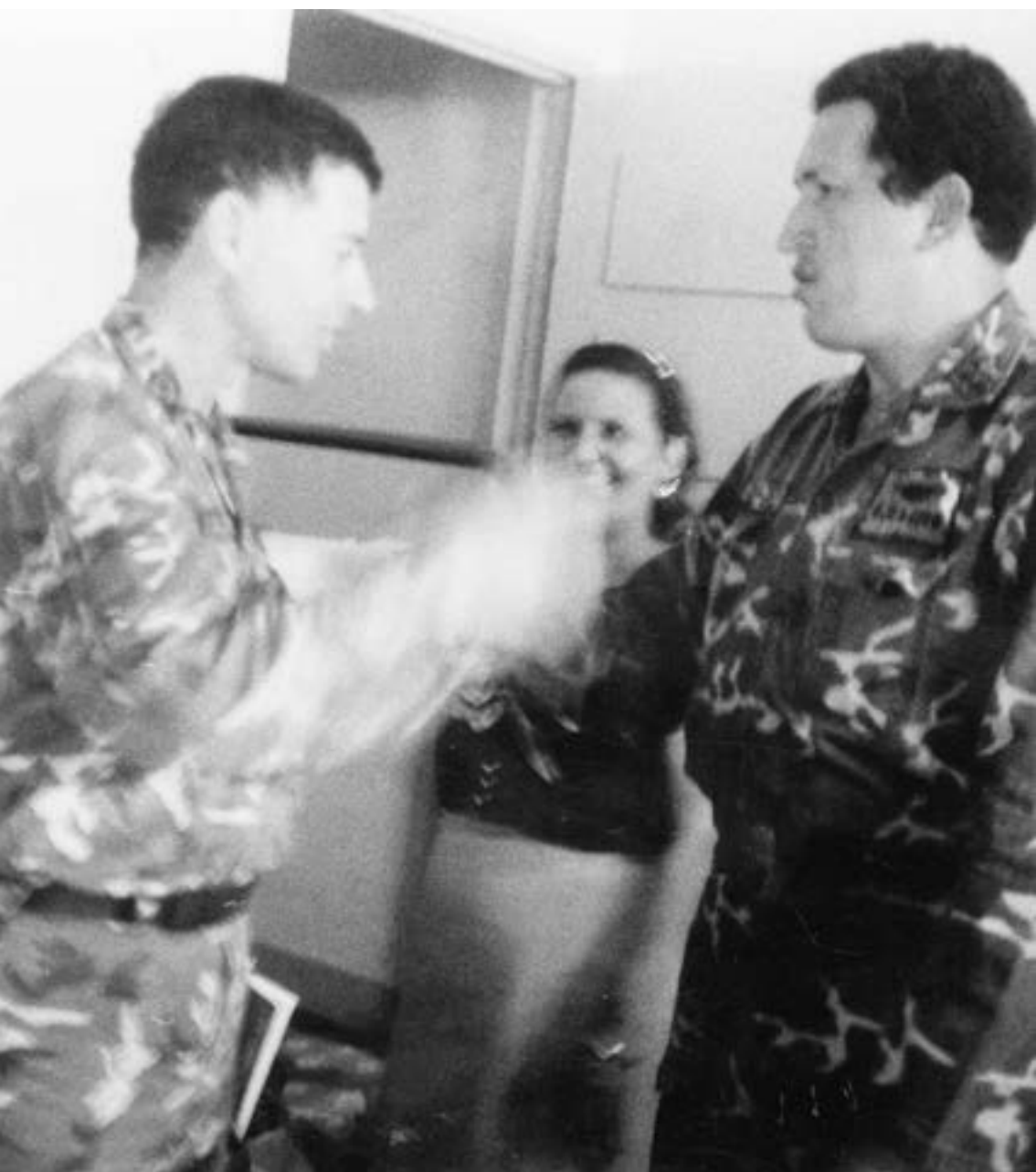
Francisco Arias Cárdenas y Hugo Chávez Frías.