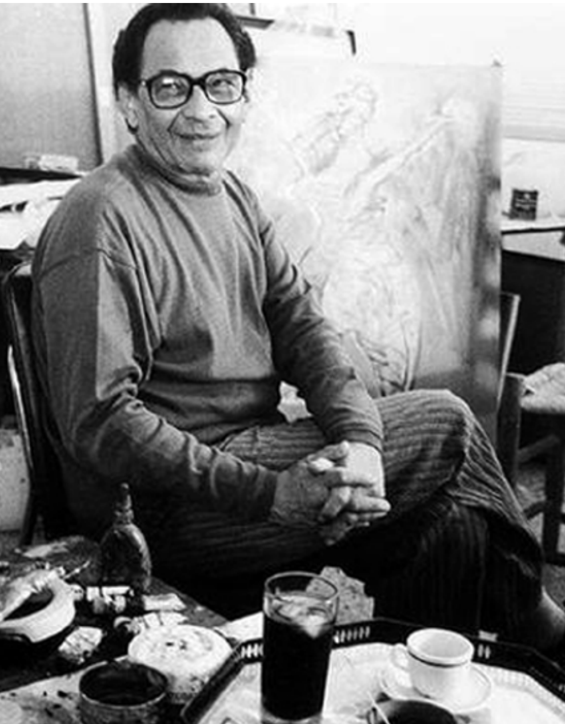
El periodista venezolano Pedro León Zapata.