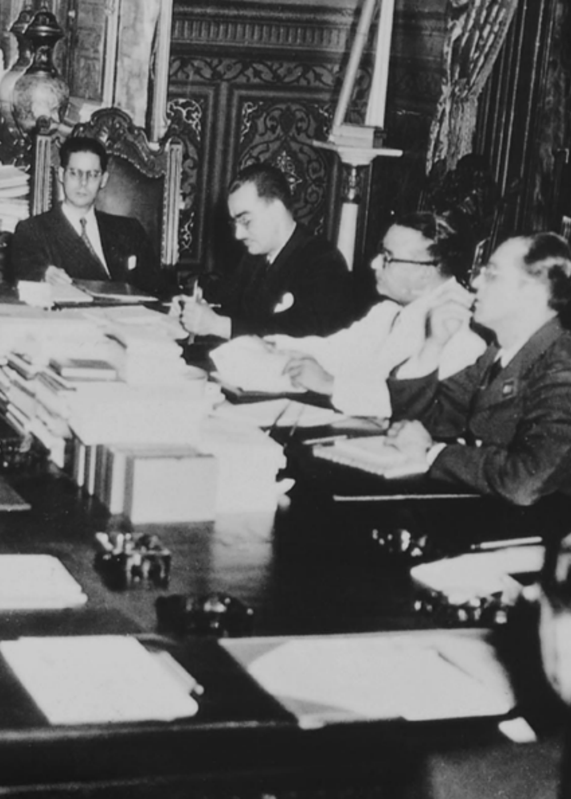
Junta Revolucionaria de Gobierno, la integrada después del golpe octubrista, bajo la presencia de Betancourt.