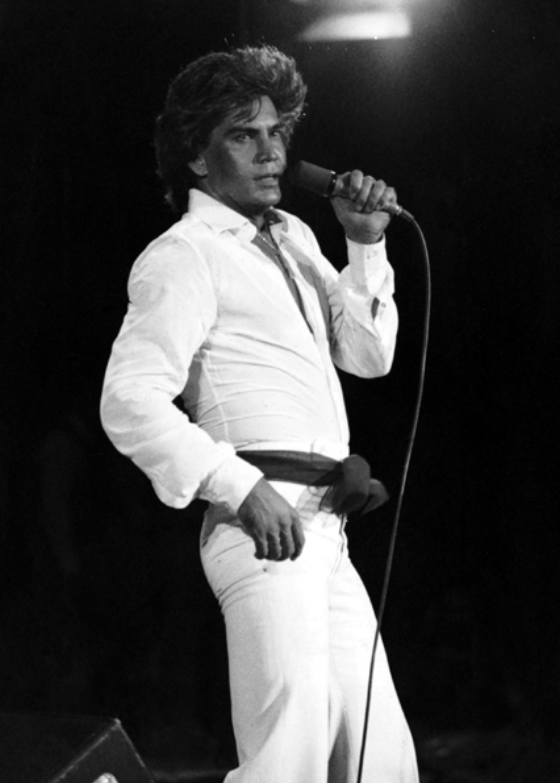
Jose Luis Rodríguez. Actor de TV que en diciembre de 1979 estaba en la cumbre con una telenovela y que en diciembre de 1992 está a punto de perderla al aspirar la candidatura presidencial.