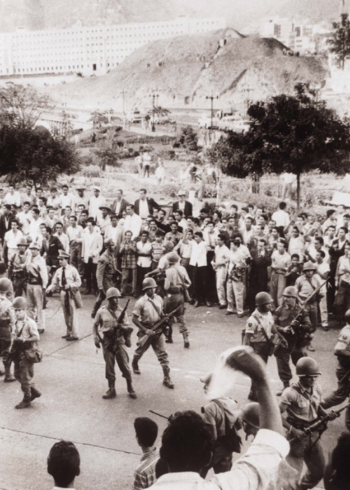
Veintitrés de enero (23E). Algo en que no creía nadie un año antes, 1957, y que sin embargo sedujo a todo el mundo en 1958.