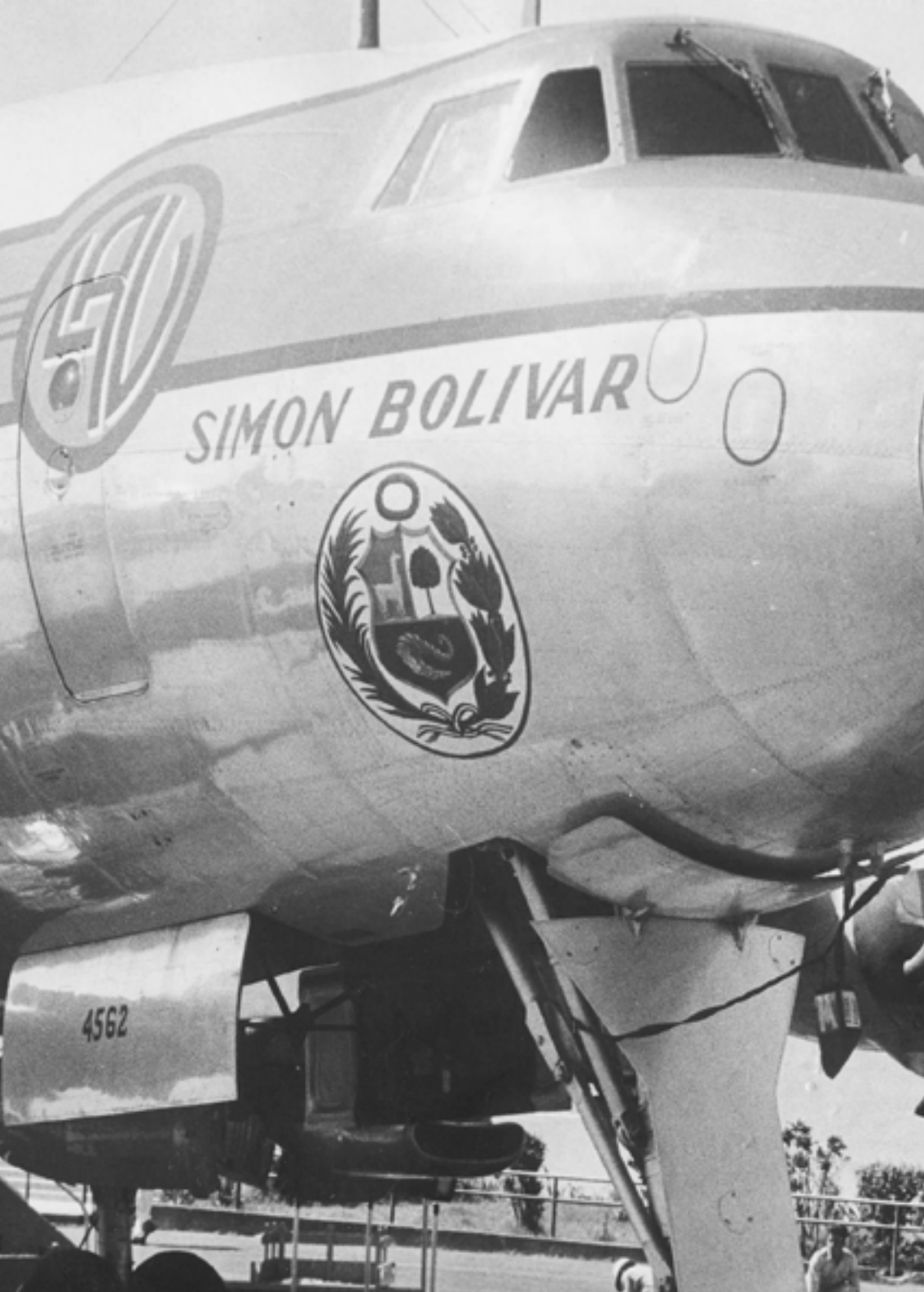
Super Constellation "Simón Bolívar" de la Línea Aeropostal Venezolana (LAV).