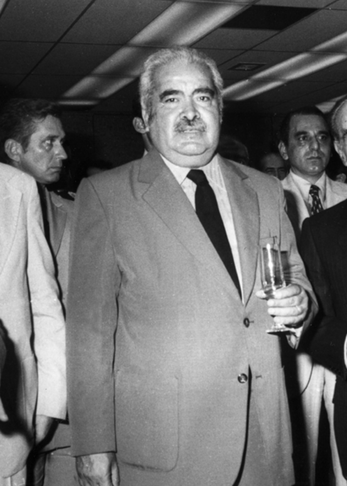
Luis Herrera Campíns. Como nuevo presidente de Copei, le puso una raya a Caldera: de aquí en adelante lo que viene es oposición.