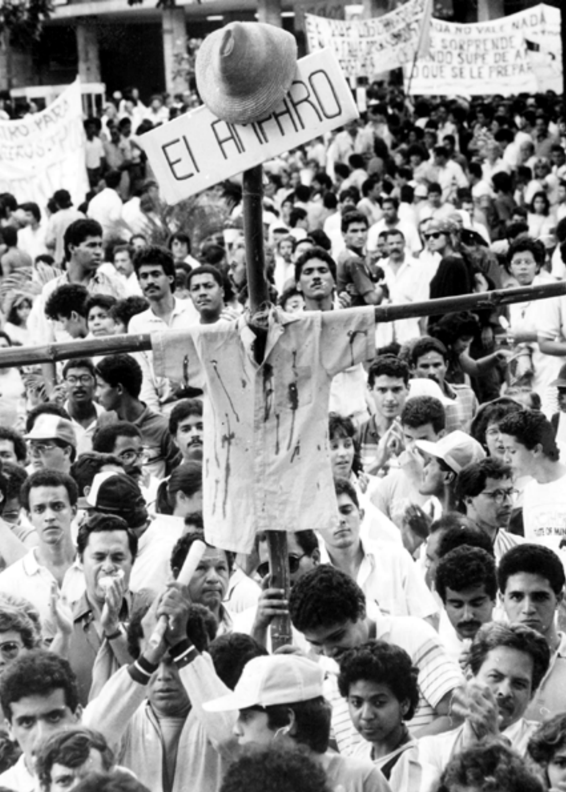
El Amparo. En noviembre de 1988 el país sigue conmocionado por la tragedia ocurrida el 28 de octubre y que constituyó el más grave escándalo político de la era de Jaime Lusinchi.