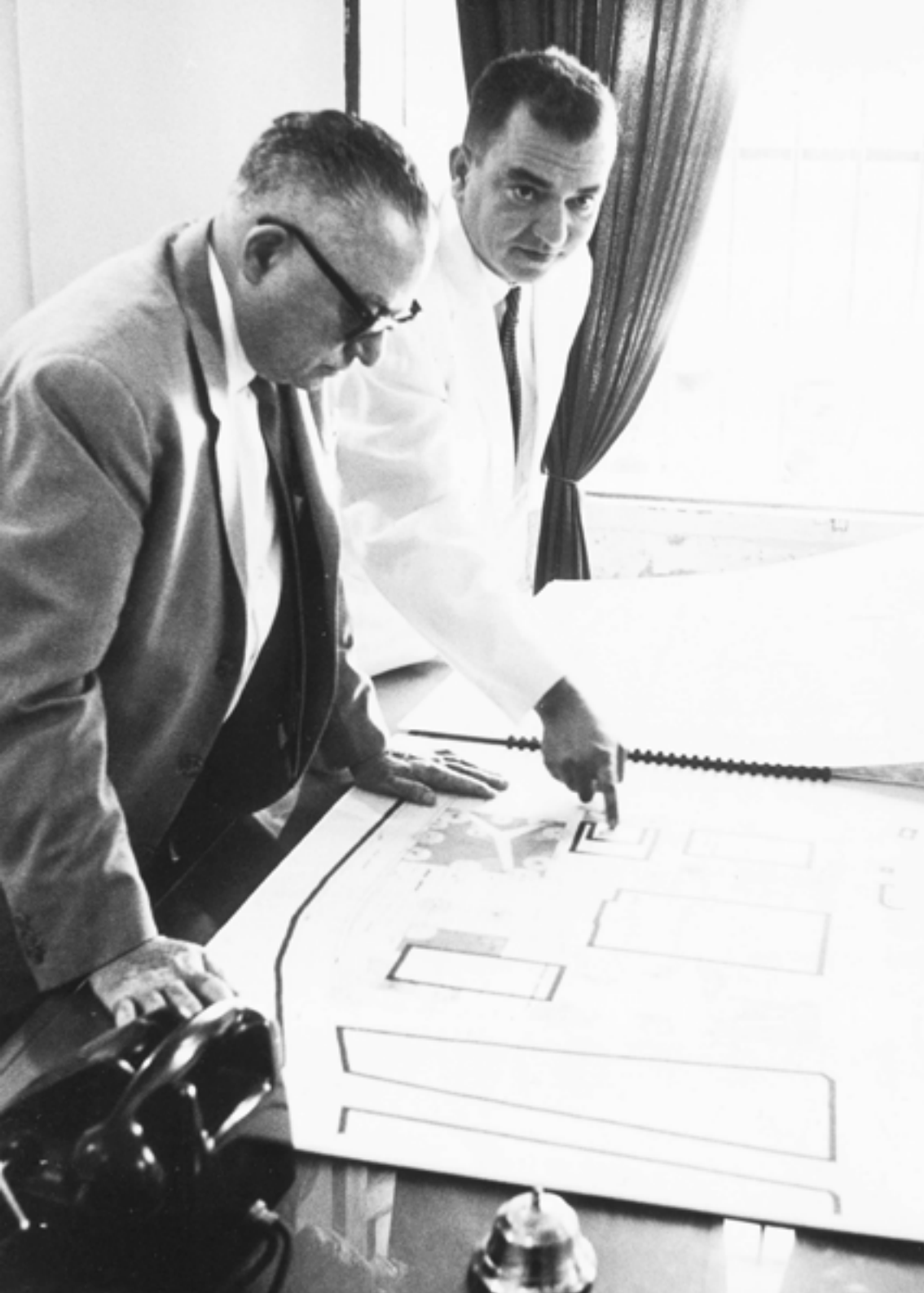
Rómulo Betancourt. Político que pasó dos veces por Miraflores. En la foto está observando planos de la iglesia de Guatire junto a Leopoldo Sucre Figarella.