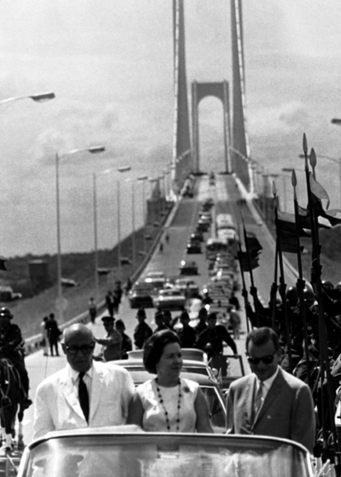
Puente Angostura. Inaugurado el 6 de enero de 1967. Se le debe a Raúl Leoni, como la primera etapa del Guri. En la imagen Raúl Leoni, Menca de Leoni y Sucre Figuerella.