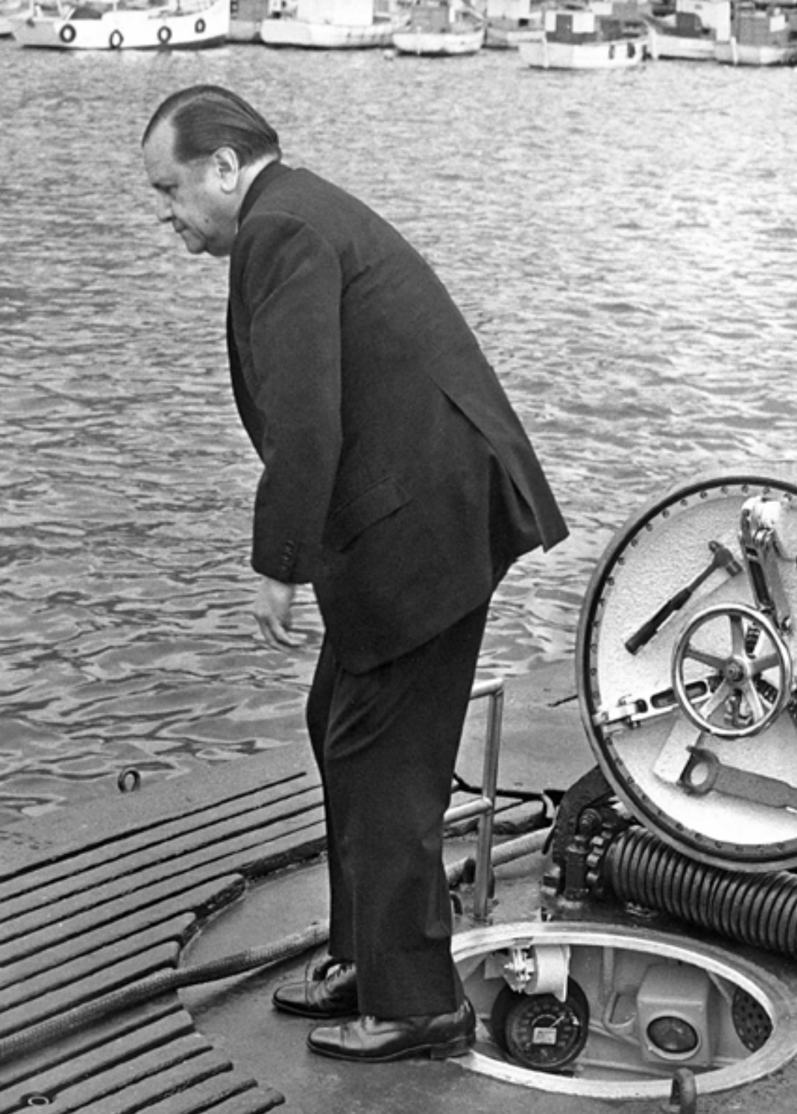
Rafael Caldera era el candidato presidencial en 1947 y tenía 31 años, por lo cual Copei puso en circulación el slogan “El presidente más joven de América”.