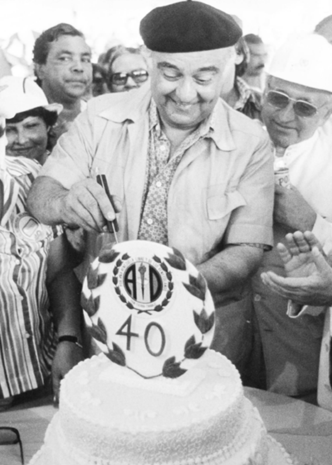
Jaime Lusinchi. El más lusinchista de todos, a quien, mudanzas del tiempo, le han salido más enemigos que amigos cuando mandaba.