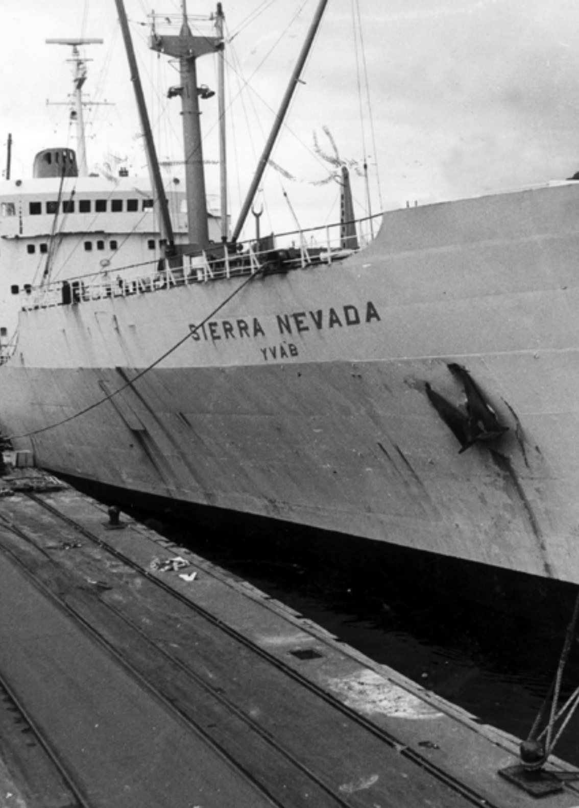
Sierra Nevada. Barco frigorífico que casi desgracia a Carlos Andrés Pérez, quien amablemente lo compró para obsequiárselo a Bolivia, país que no tiene salida al mar. ¡Ups!