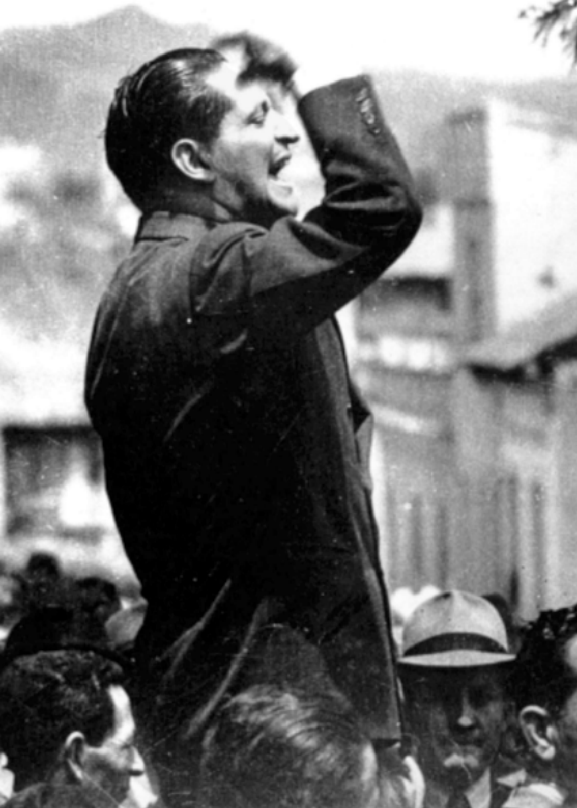
Bogotazo. Aunque ya Colombia estaba alborotada desde 1946, fue el 9 de abril de 1948 cuando estalló el bogotazo tras el asesinato de Gaitán.