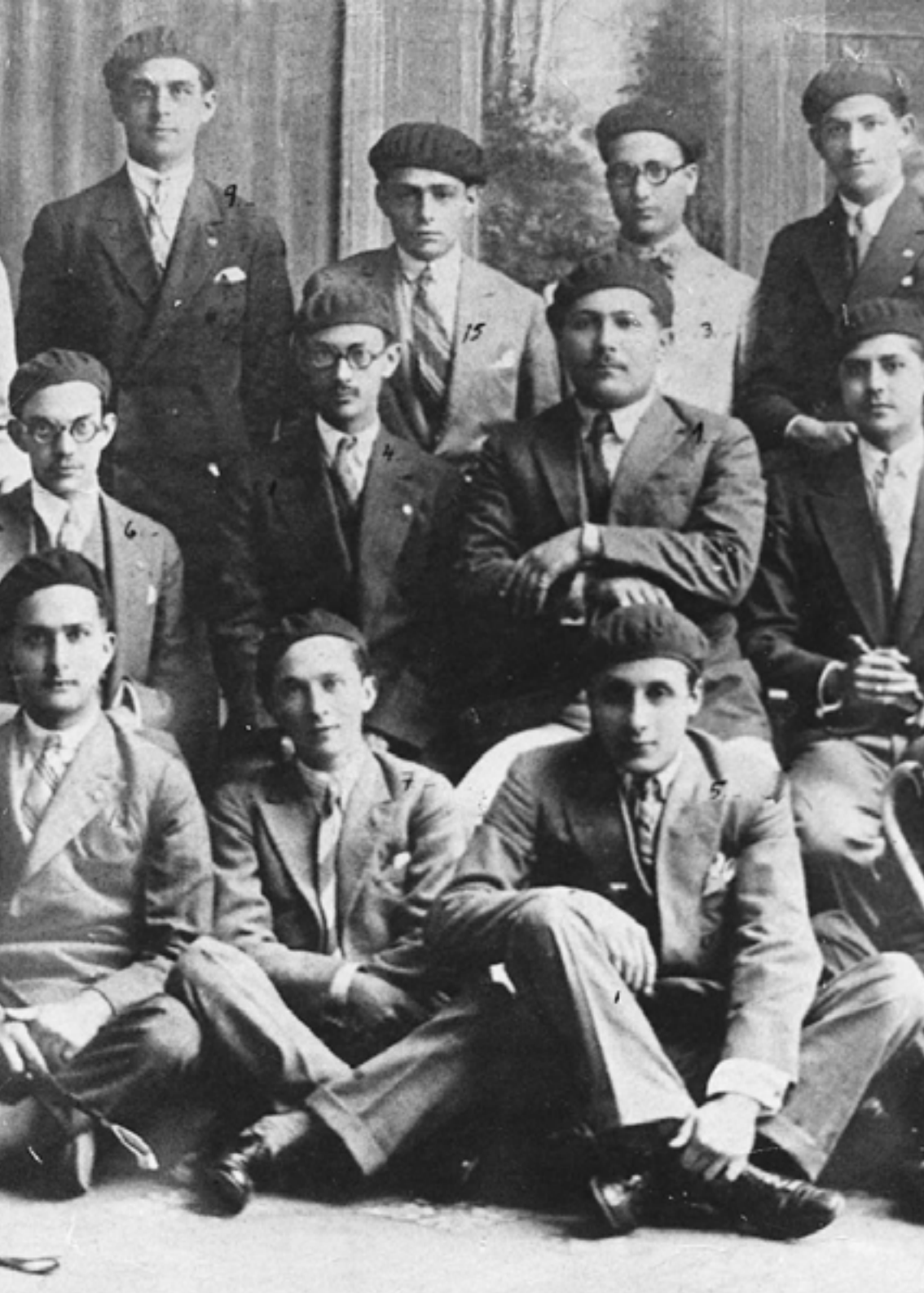
Semana del estudiante. La de 1928 reveló a la célebre generación, muchos de cuyos miembros participarían en “el complot de abril”. Foto tomada días antes de estallar el complot.